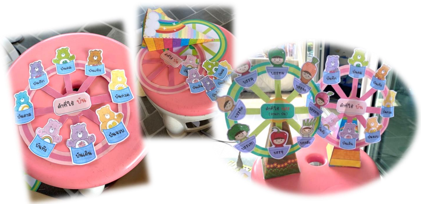
ภาพประกอบ (ภาพสื่อการสอน หรือ บรรยากาศการเรียนที่ใช้สื่อการสอน)

เป็นสื่อการเรียนรู้ที่ครูผู้สอนผลิตขึ้นมาเอง ซึ่งผู้เรียนสามารถใช้สื่อนี้ในการเรียนรู้ได้ตลอดเวลาที่ว่าง โดยการเล่นแบบหมุนเพื่อดูคำศัพท์ว่าคำใดใช้บัน คำใดใช้บรร. สามารถเล่นเดี่ยวหรือเป็นทีมก็ได้