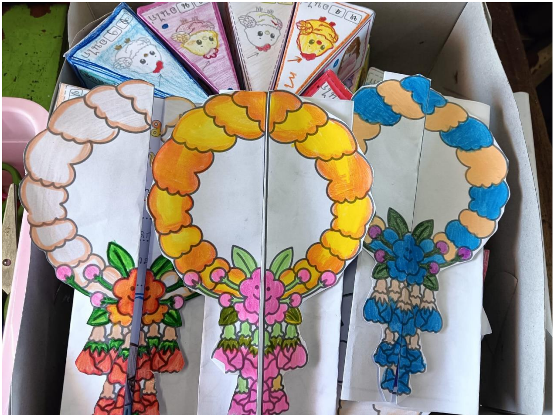
สื่อและผลงานการอ่านการเขียน