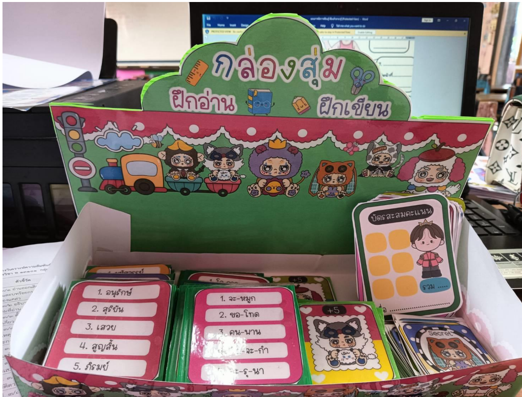
สื่อ กล่องสุ่ม ฝึกอ่าน ฝึกเขียน