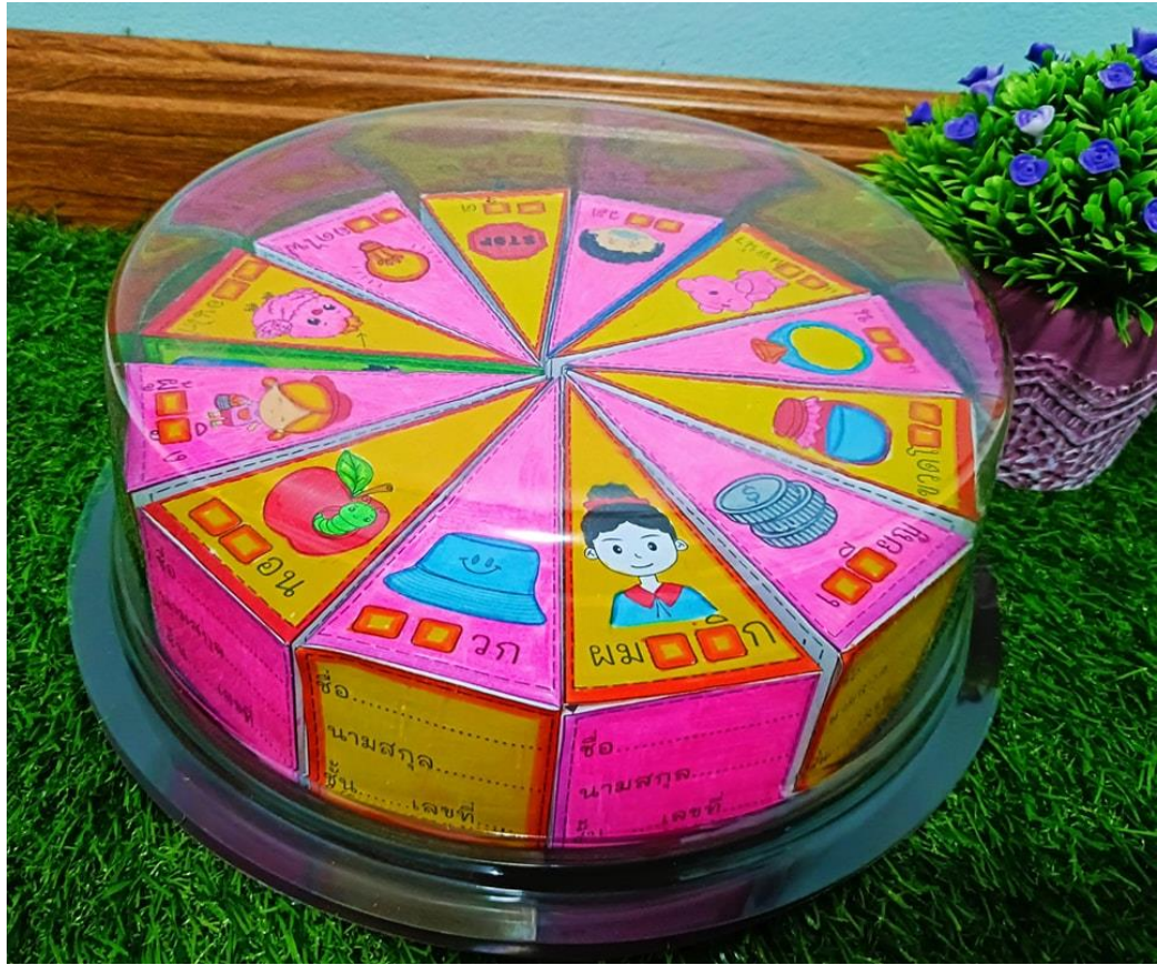
สื่อมาตราตัวสะกด และชิ้นงานนักเรียน