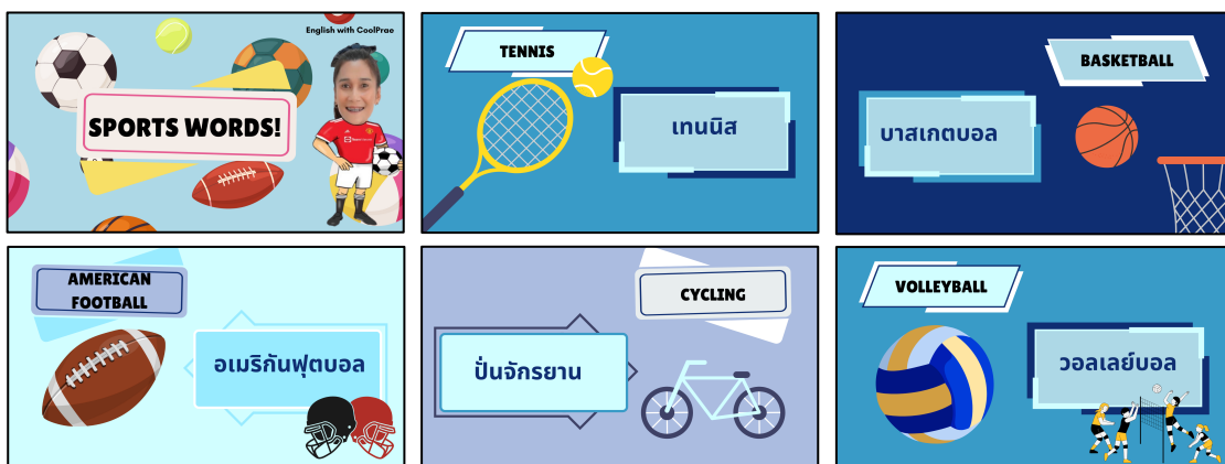
ภาพประกอบ ภาพสื่อการสอน เรื่อง Sports words (สรุปคำศัพท์และประโยคเกี่ยวกับกีฬา)

สรุปเนื้อหาการสอนคำศัพท์และประโยคเกี่ยวกับกีฬา (Sports) ที่มีเนื้อหาที่มีความเหมาะสมกับระดับชั้นและสอดคล้องกับหลักสูตรแผนการสอนที่เข้าใจง่าย โดยจัดทำรายละเอียดการสอนในรูปแบบของคลิปวิดีโอที่มีรูปภาพประกอบและสีสันที่สดใส เพื่อสร้างความน่าสนใจให้กับนักเรียน