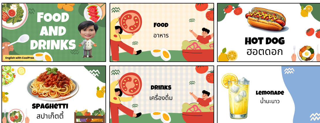
ภาพประกอบ ภาพสื่อการสอนเรื่อง Food and Drinks (คำศัพท์และประโยคเกี่ยวกับอาหารและเครื่องดื่ม)

สรุปเนื้อหาการสอนคำศัพท์และประโยคเกี่ยวกับเรื่อง Food and Drinks (คำศัพท์และประโยคเกี่ยวกับอาหารและเครื่องดื่ม) ...ที่มีเนื้อหาที่มีความเหมาะสมกับระดับชั้นและสอดคล้องกับหลักสูตรแผนการสอนที่เข้าใจง่าย โดยจัดทำรายละเอียดการสอนในรูปแบบของคลิปวิดีโอที่มีรูปภาพประกอบสร้างความน่าสนใจให้กับนักเรียนมากขึ้นผ่านทางช่องทาง www.youtube.com ในช่องที่ชื่อว่า Iprae Suwannachart