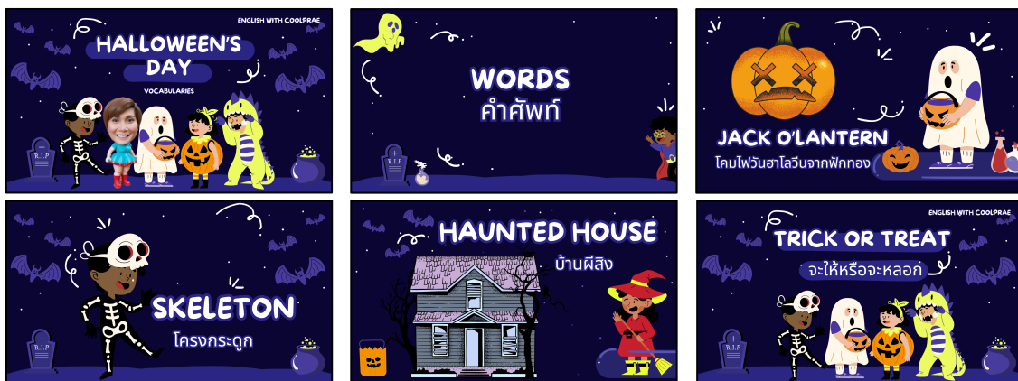
ภาพประกอบ ภาพสื่อการสอนเรื่อง Halloween Festivals (สรุปคำศัพท์และประโยคเกี่ยวกับเทศกาลฮาโลวีน)

สรุปเนื้อหาการสอนคำศัพท์และประโยคเกี่ยวกับเรื่อง Halloween Festivals (สรุปคำศัพท์และประโยคเกี่ยวกับเทศกาลฮาโลวีน) ที่มีเนื้อหาที่มีความเหมาะสมกับระดับชั้นและสอดคล้องกับหลักสูตรแผนการสอนที่เข้าใจง่าย โดยจัดทำรายละเอียดการสอนในรูปแบบของคลิปวิดีโอที่มีรูปภาพประกอบสร้างความน่าสนใจให้กับนักเรียนมากขึ้นผ่านทางช่องทาง www.youtube.com ในช่องที่ชื่อว่า Iprae Suwannachart