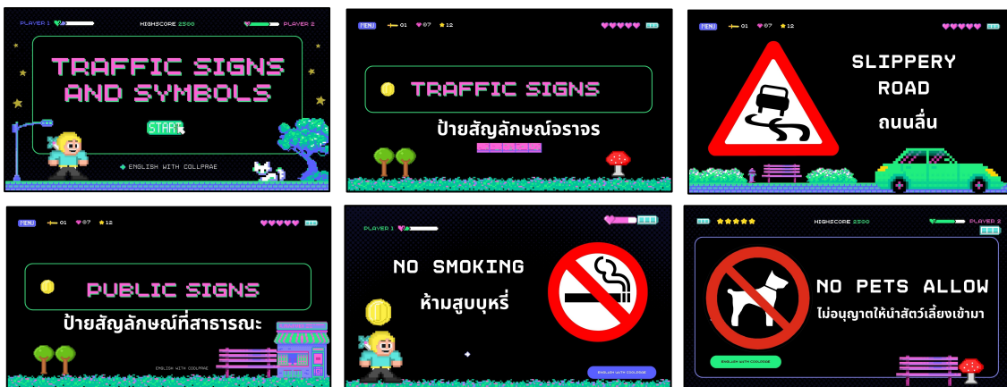
ภาพประกอบ ภาพสื่อการสอนเรื่อง Traffic and public signs (สรุปคำศัพท์เกี่ยวกับป้ายและสัญลักษณ์)

สรุปเนื้อหาการสอนคำศัพท์เกี่ยวกับป้ายและสัญลักษณ์ต่าง ๆ โดยมีเนื้อหาที่มีความเหมาะสมกับระดับชั้นและสอดคล้องกับหลักสูตรแผนการสอนที่เข้าใจง่าย โดยจัดทำรายละเอียดการสอนในรูปแบบของคลิปวิดีโอที่มีรูปภาพประกอบสร้างความน่าสนใจให้กับนักเรียนมากขึ้นผ่านทางช่องทาง www.youtube.com ในช่องที่ชื่อว่า Iprae Suwannachart