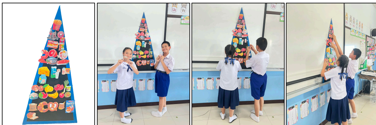
ภาพประกอบ ภาพสื่อการสอน เรื่อง สื่อพัฒนาทักษะทางด้านคำศัพท์อาหารและเครื่องดื่ม โดยใช้ Food Pyramid

เป็นสื่อพัฒนาทักษะทางด้านคำศัพท์เกี่ยวกับอาหารและเครื่องดื่ม เรื่องอาหารที่มีประโยชน์ (Healthy food) และอาหารที่ไม่มีประโยชน์ (Unhealthy food). โดยใช้สื่อในการทำกิจกรรม Food Pyramid เพื่อทบทวนคำศัพท์เกี่ยวกับอาหารและเครื่องดื่มรวมถึงวิเคราะห์อาหารตามหมู่ของอาหารอย่างถูกต้อง โดยสื่อมีเนื้อหาที่มีความเหมาะสมกับระดับชั้นและสอดคล้องกับหลักสูตรแผนการสอนที่เข้าใจง่าย