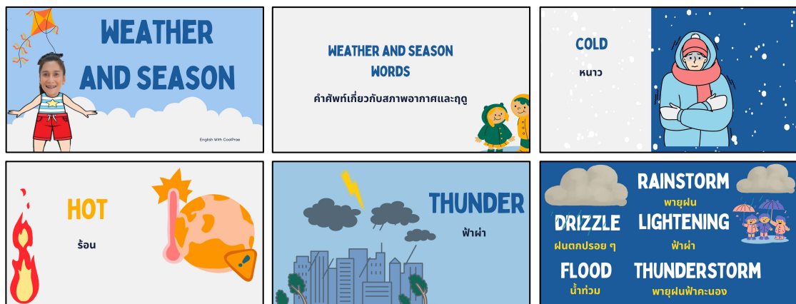
ภาพประกอบ ภาพสื่อการสอนเรื่อง Weather and Seasons words (สรุปคำศัพท์เรื่องสภาพอากาศและฤดู)

สรุปเนื้อหาการสอนคำศัพท์และประโยคเกี่ยวกับ Weather and Seasons words... (สรุปคำศัพท์และประโยคสภาพอากาศและฤดู ที่มีเนื้อหาที่มีความเหมาะสมกับระดับชั้นและสอดคล้องกับหลักสูตรแผนการสอนที่เข้าใจง่าย โดยจัดทำรายละเอียดการสอนในรูปแบบของคลิปวิดีโอที่มีรูปภาพประกอบสร้างความน่าสนใจให้นักเรียนมากขึ้นผ่านทางช่องทาง www.youtube.com ในช่องที่ชื่อว่า Iprae Suwannachart