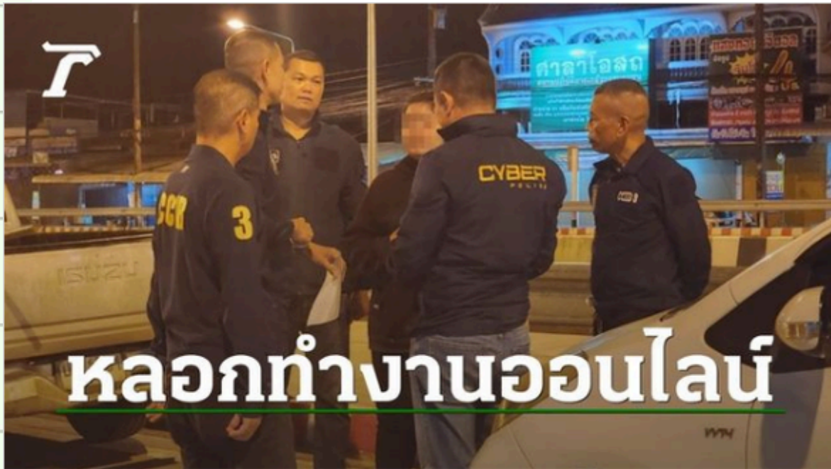
รวบสาววัย 30 เครื่องข่ายหลอกทำงานออนไลน์ เหยื่อหลงเชื่อโอนเงินกว่า 1.7 ล้าน