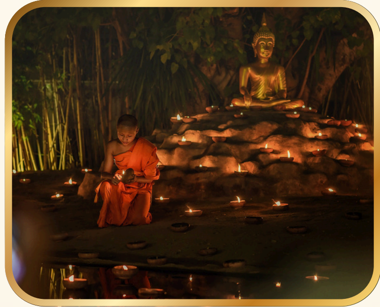
เวียนเทียนรอบพระอุโบสถ