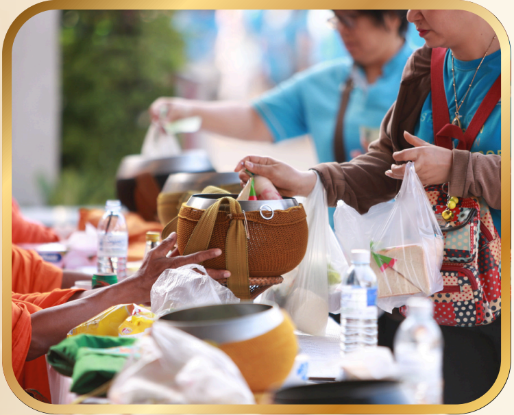
ทำบุญ ตักบาตร ฟังเทศน์