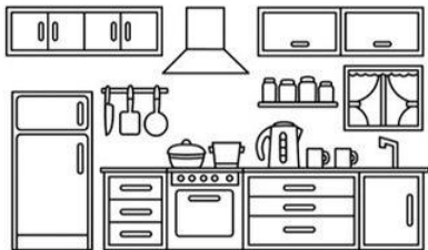
ห้องครัว