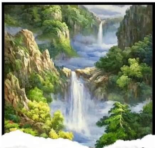
ตัวอย่างภาพสีวรรณะเย็น