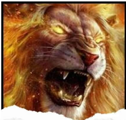
ตัวอย่างภาพสีวรรณะร้อน