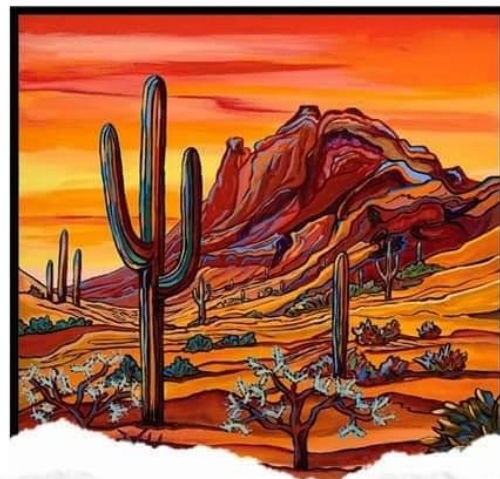
ตัวอย่างภาพสีวรรณะร้อน