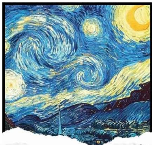
ตัวอย่างภาพสีวรรณะเย็น