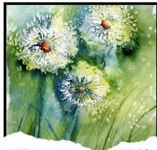
ตัวอย่างภาพสีวรรณะเย็น