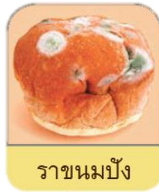
ราขนมปัง