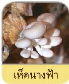
เห็ดนางฟ้า