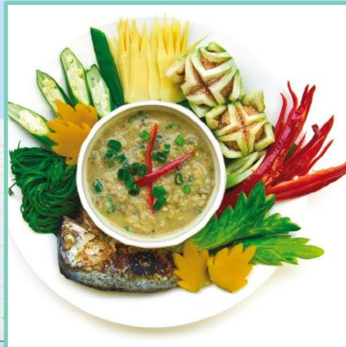
การจัดตกแต่งอาหารให้น่ารับประทาน ด้วยการจัดผักเป็นกลุ่ม ๆ วางรอบถ้วยน้ำพริก

๑.๔ จัดอาหารให้น่ารับประทาน เพื่อไม่ให้ผู้รับประทานเกิดความเบื่อหน่ายและได้รับสารอาหารซ้ำ ๆ โดยจัดให้รายการอาหารแต่ละมื้อในแต่ละวันไม่ซ้ำกัน ทั้งรสชาติและลักษณะของอาหาร รวมถึงมีการจัดตกแต่งอาหาร เช่น การแกะสลักผักทองเป็นภาชนะใส่ น้ำพริก การจัดผักเป็นกลุ่ม ๆ วางรอบถ้วยน้ำพริก แกะสลักแตงกวา และพริกชี้ฟ้าแดงตกแต่งจานข้าวผัด