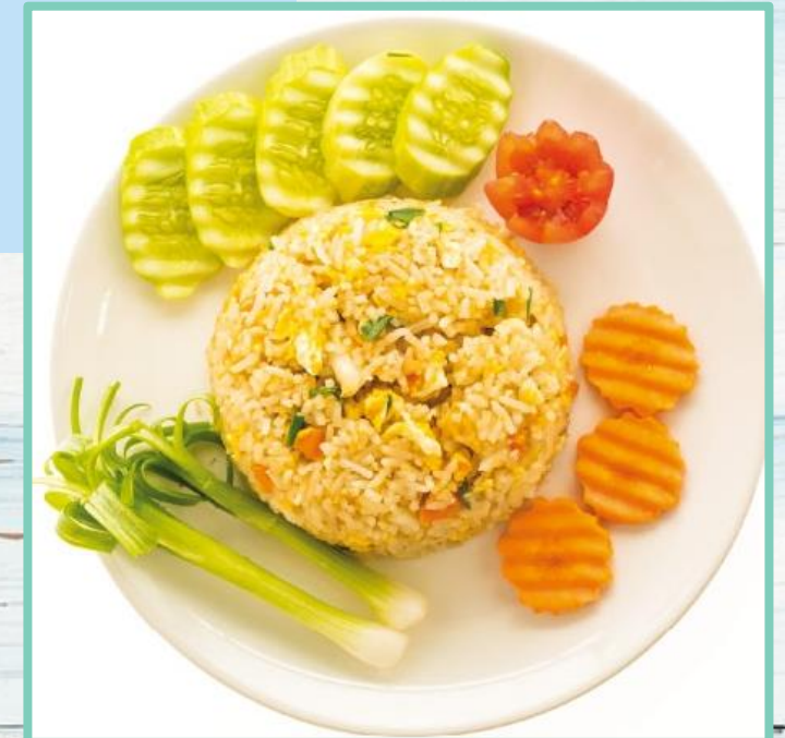
การจัดตกแต่งจานข้าวผัดให้น่ารับประทาน ด้วยแตงกวาแกะสลัก มะเขือเทศ และพริกชี้ฟ้าแดง