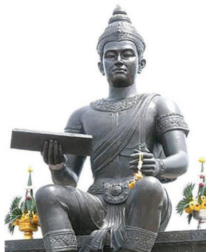
พ่อขุนรามคำแหงมหาราช