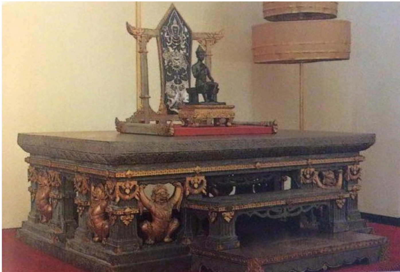
พระแท่นมั่งคศิลาบาตร