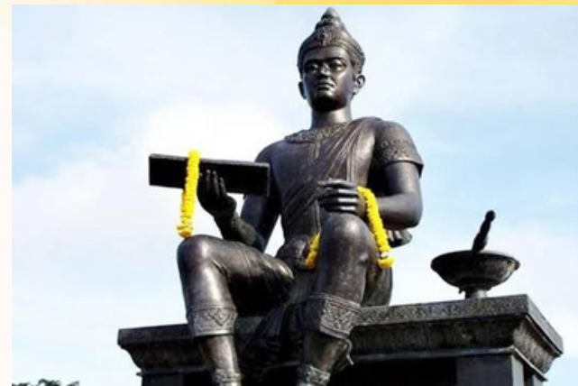
พ่อขุนรามคำแหงมหาราช