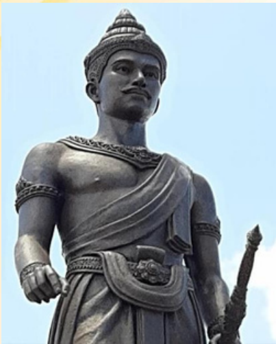
พ่อขุนศรีอินทราทิตย์