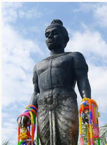
พ่อขุนบานเมือง