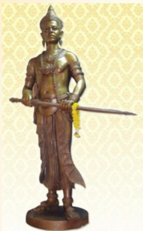
พ่อขุนศรีอินทราทิตย์