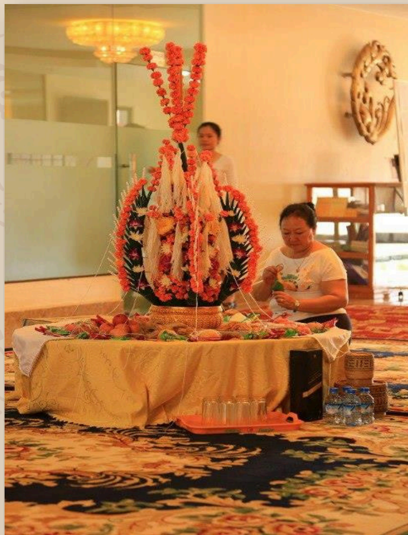
ศาสนา/ความเชื่อ