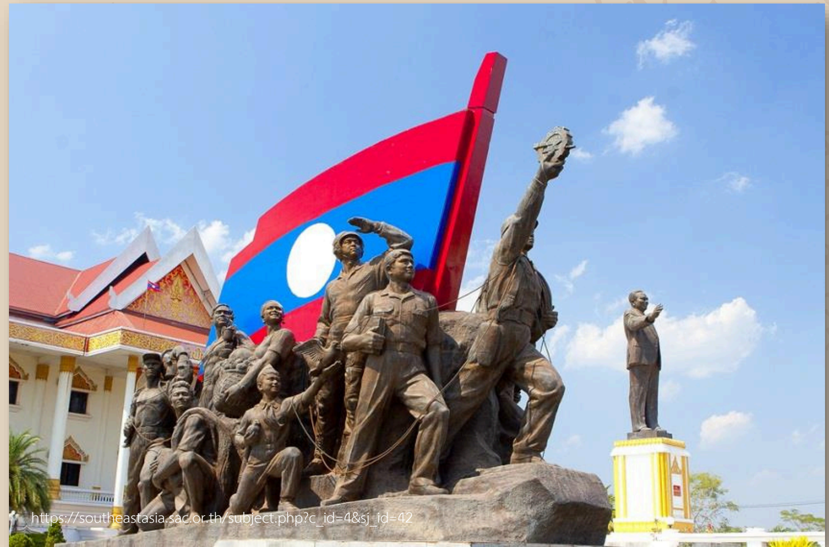
พิพิธภัณฑ์ไกสอนพมวิหาน