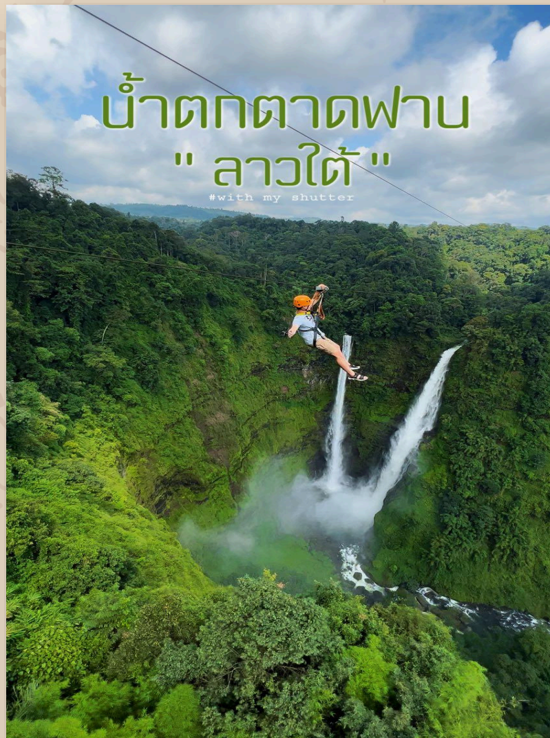
การท่องเที่ยว