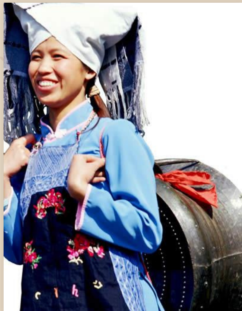
ความหลากหลาย ทางชาติพันธุ์