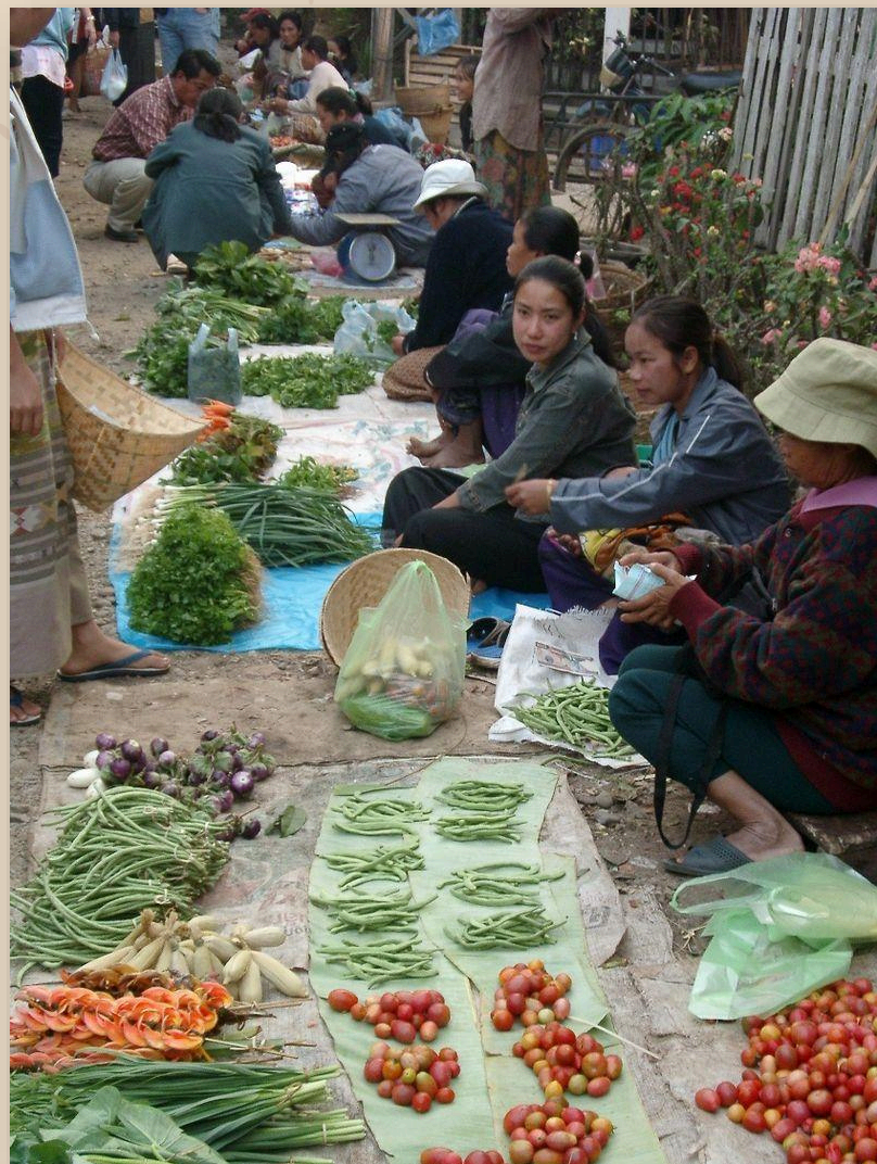
สินค้าเกษตร