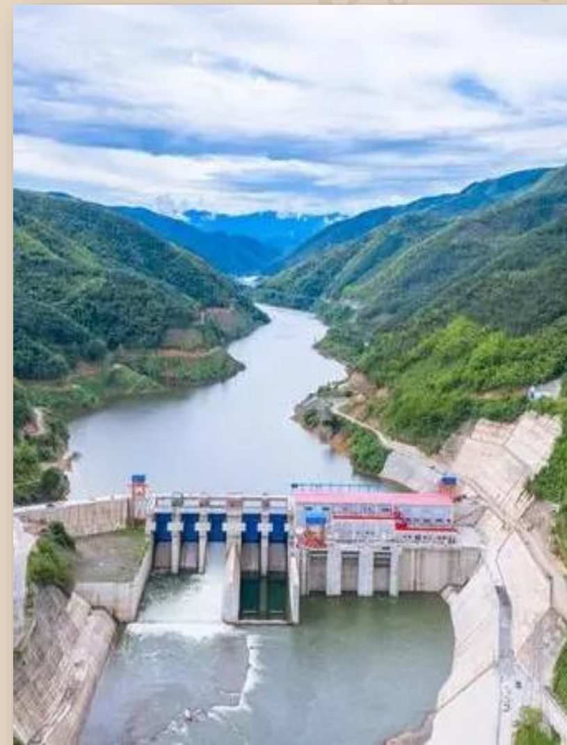
เขื่อนผลิตไฟฟ้า