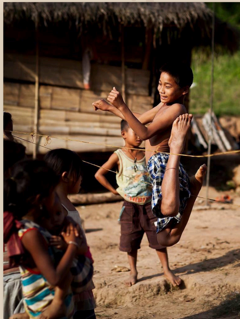
สังคมชนบท