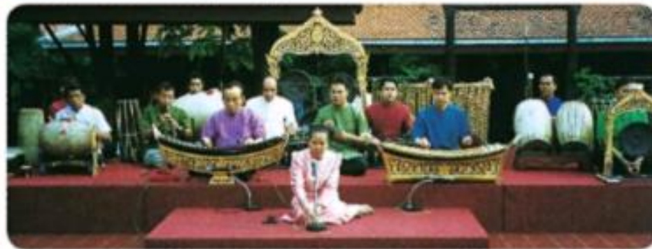
การขับร้องเพลงไทย