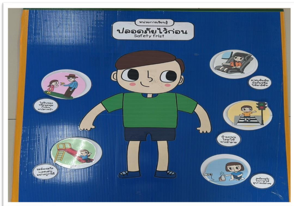
ภาพประกอบ (ภาพสื่อการสอน หรือ บรรยากาศการเรียนรู้ที่ใช้สื่อการสอน)

ก่อนที่จะเรียนรู้เนื้อหาได้เข้าสู่บทเรียนด้วยบทเพลงประกอบจังหวะ จากนั้นอธิบายเกี่ยวกับเรื่อง ปลอดภัยไว้ก่อน การดูแลความปลอดภัยของตนเองจากการเล่น การข้ามถนน รวมถึงการไม่รับของจากคนแปลกหน้า เป็นต้น...ซึ่งเด็กได้มีส่วนร่วมการเรียนรู้จากสื่อเสริมประสบการณ์