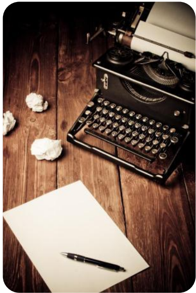
การพิมพ์