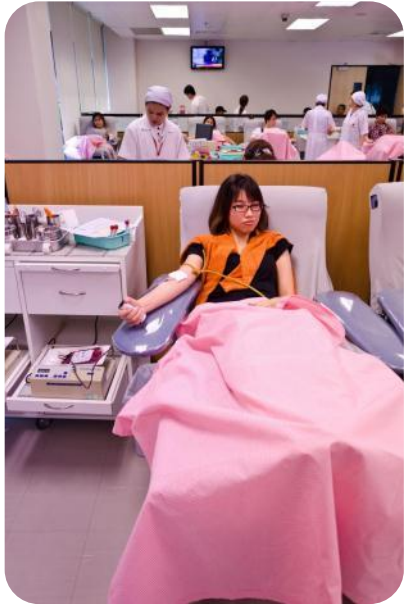
การแพทย์แบบ ตะวันตก