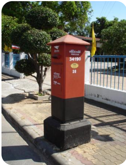
ระบบไปรษณีย์