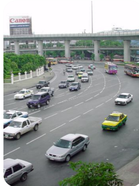
การสร้างถนน