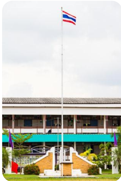
การก่อตั้งโรงเรียน