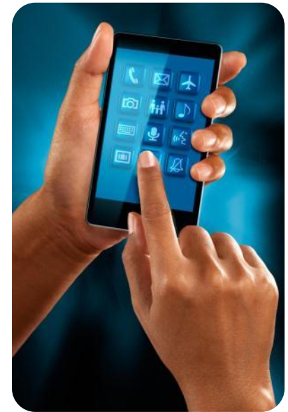
โทรศัพท์