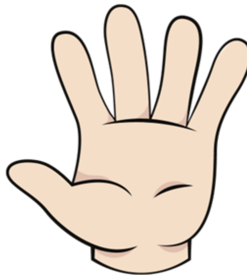
พระหัตถ์