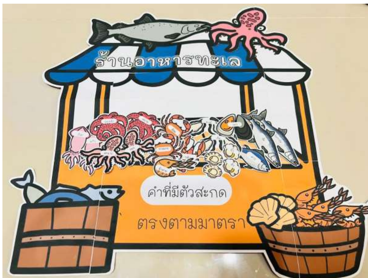
ภาพประกอบ (ภาพสื่อการสอน หรือ บรรยากาศการเรียนรู้ที่ใช้สื่อการสอน)