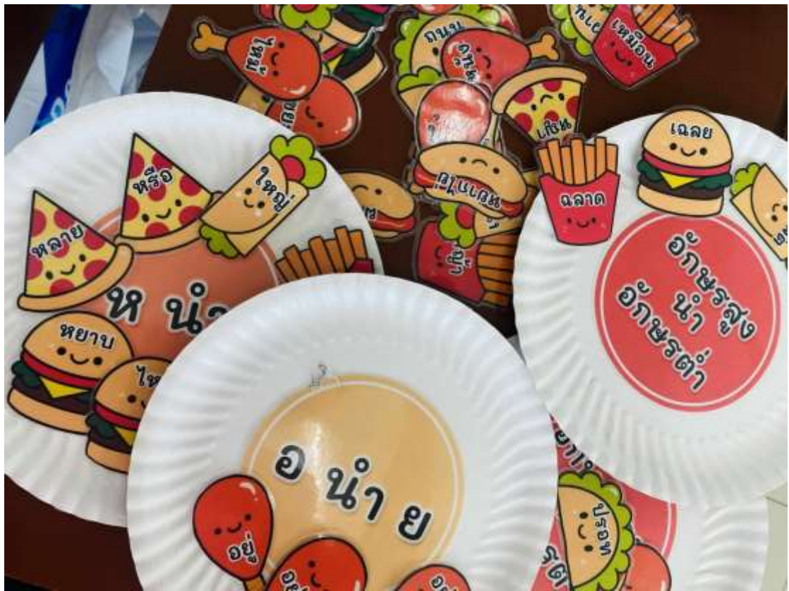
ภาพประกอบ (ภาพสื่อการสอน หรือ บรรยากาศการเรียนที่ใช้สื่อการสอน)