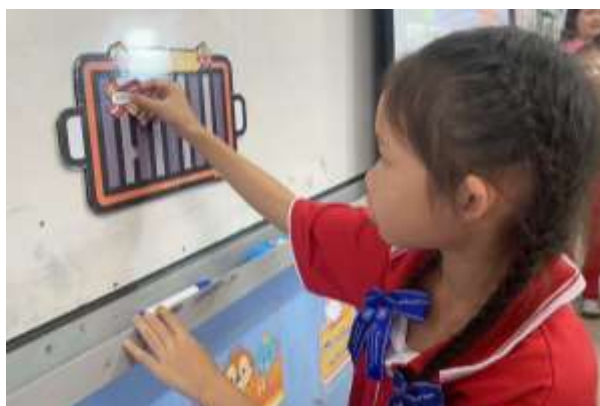
ภาพประกอบ (ภาพสื่อการสอน หรือ บรรยากาศการเรียนที่ใช้สื่อการสอน)