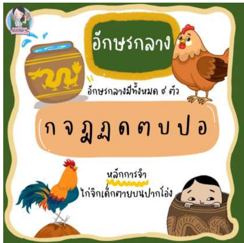
ภาพประกอบ (ภาพสื่อการสอน หรือ บรรยากาศการเรียนที่ใช้สื่อการสอน)