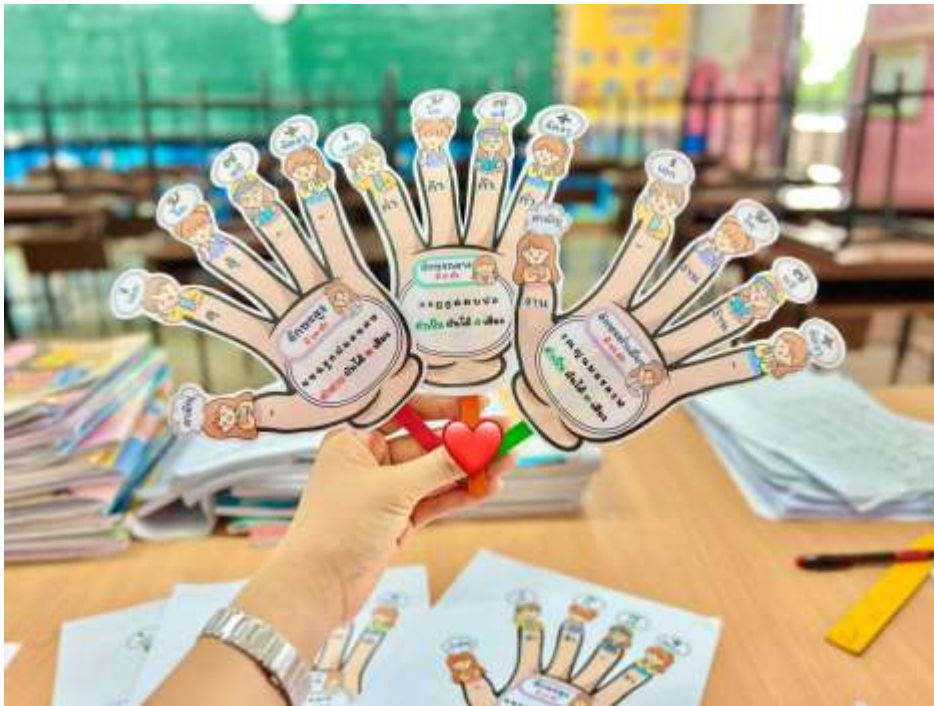
ภาพประกอบ (ภาพสื่อการสอน หรือ บรรยากาศการเรียนที่ใช้สื่อการสอน)