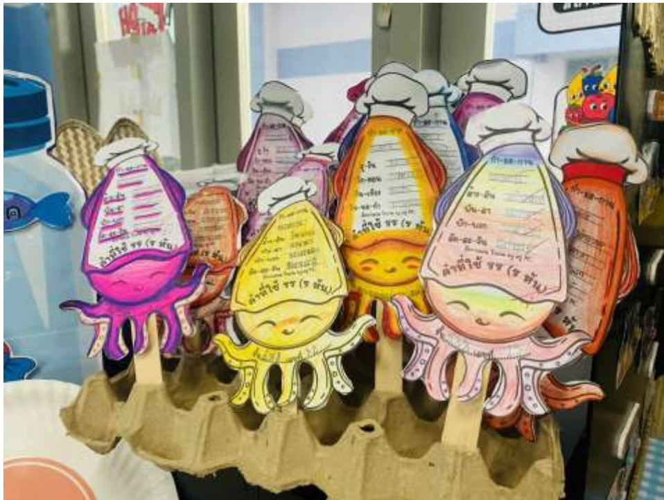
ภาพประกอบ (ภาพสื่อการสอน หรือ บรรยากาศการเรียนที่ใช้สื่อการสอน)