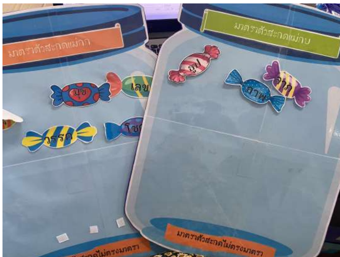
ภาพประกอบ (ภาพสื่อการสอน หรือ บรรยากาศการเรียนรู้ที่ใช้สื่อการสอน)