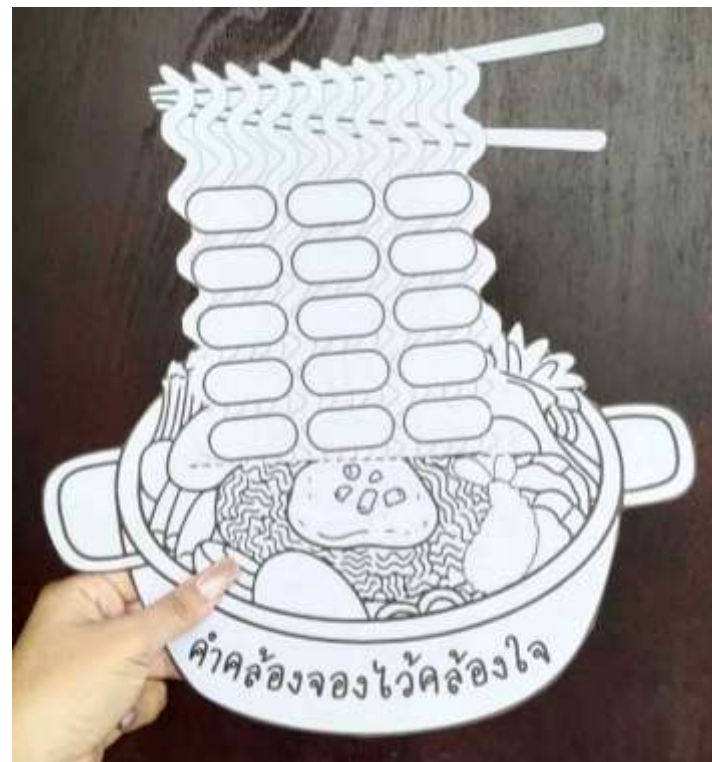
ภาพประกอบ (ภาพสื่อการสอน หรือ บรรยากาศการเรียนที่ใช้สื่อการสอน)