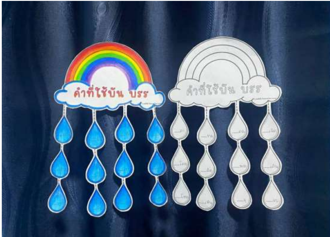
ภาพประกอบ (ภาพสื่อการสอน หรือ บรรยากาศการเรียนที่ใช้สื่อการสอน)