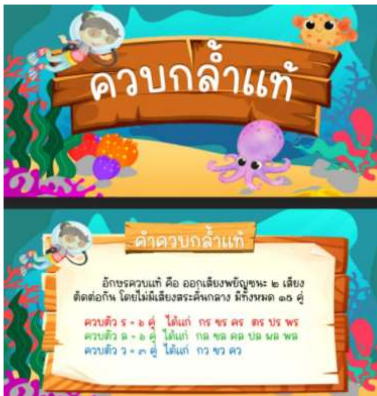
ภาพประกอบ (ภาพสื่อการสอน หรือ บรรยากาศการเรียนรู้ที่ใช้สื่อการสอน)