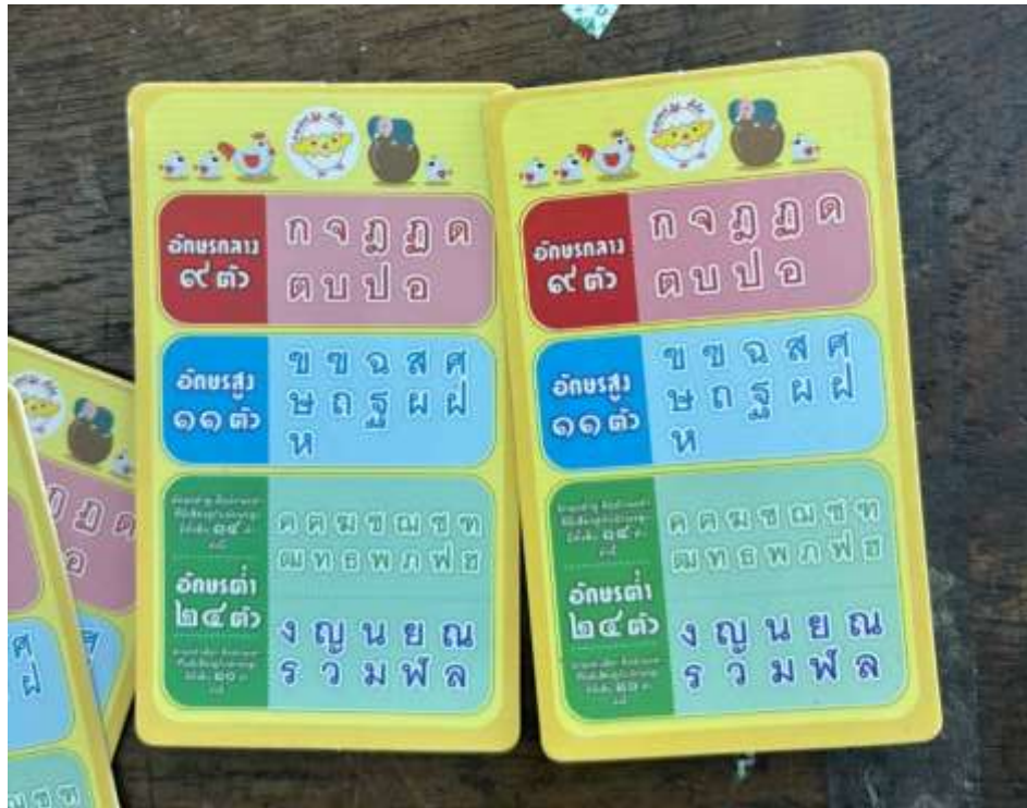
ภาพประกอบ (ภาพสื่อการสอน หรือ บรรยากาศการเรียนที่ใช้สื่อการสอน)