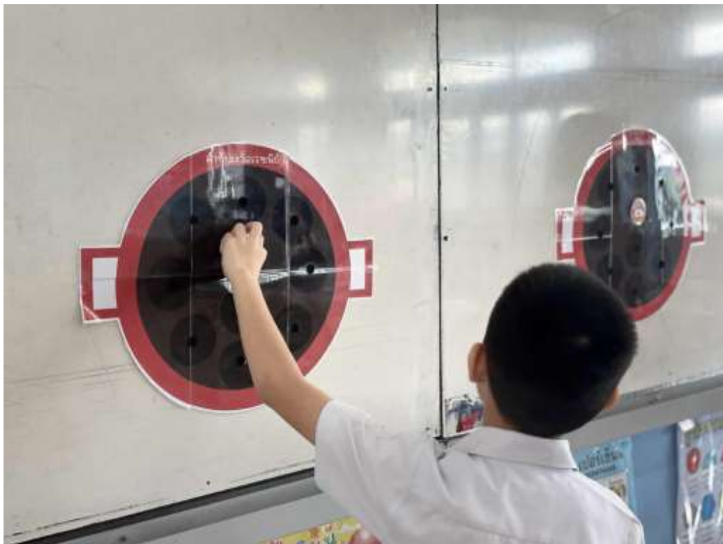
ภาพประกอบ (ภาพสื่อการสอน หรือ บรรยากาศการเรียนรู้ที่ใช้สื่อการสอน)