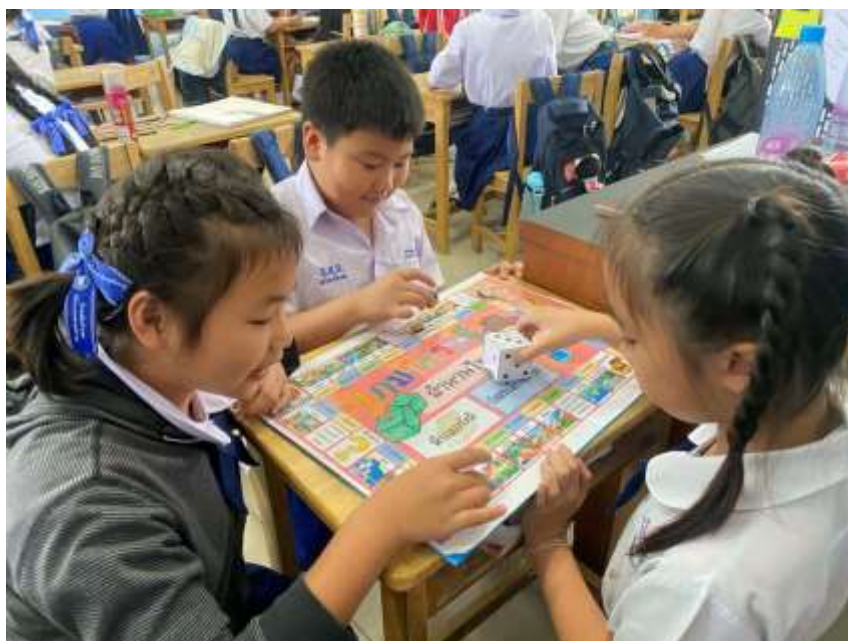
ภาพประกอบ (ภาพสื่อการสอน หรือ บรรยากาศการเรียนรู้ที่ใช้สื่อการสอน)