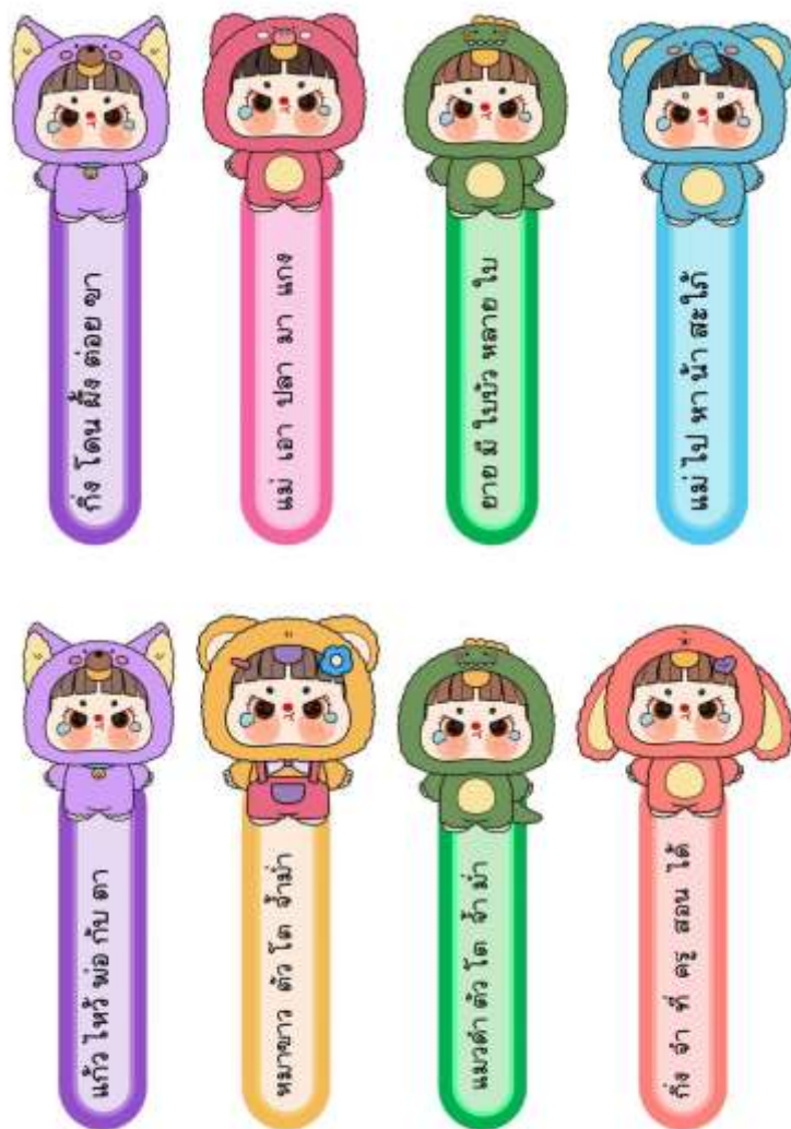
ภาพประกอบ (ภาพสื่อการสอน หรือ บรรยากาศการเรียนรู้ที่ใช้สื่อการสอน)