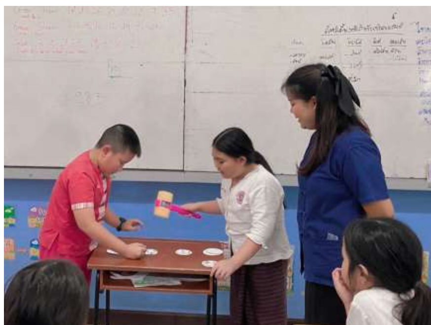
ภาพประกอบ (ภาพสื่อการสอน หรือ บรรยากาศการเรียนที่ใช้สื่อการสอน)