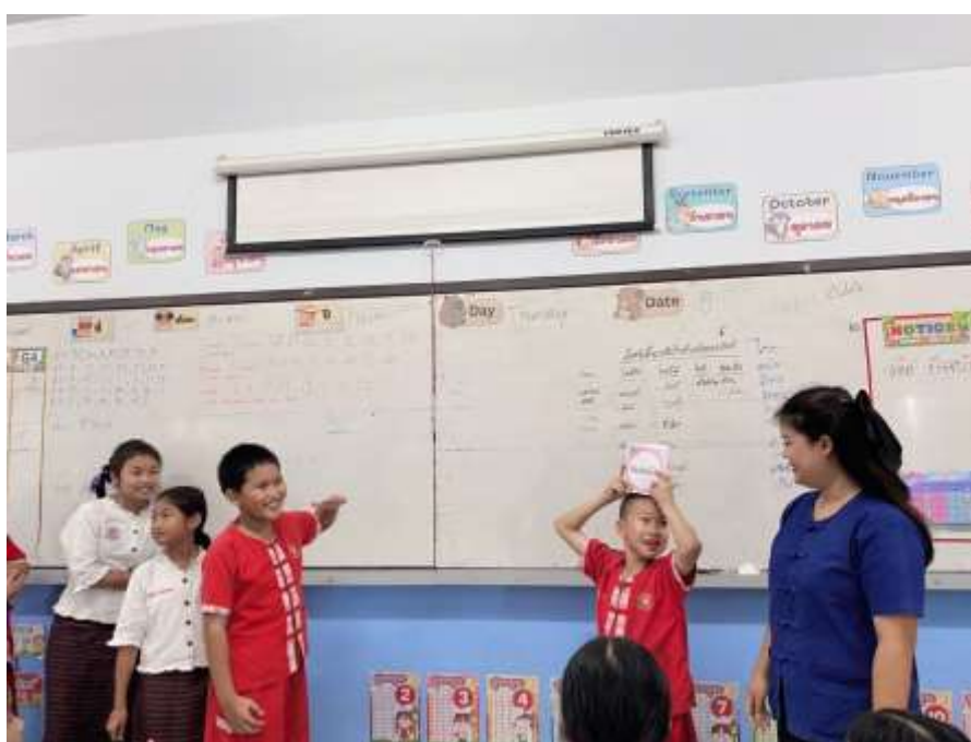
ภาพประกอบ (ภาพสื่อการสอน หรือ บรรยากาศการเรียนที่ใช้สื่อการสอน)