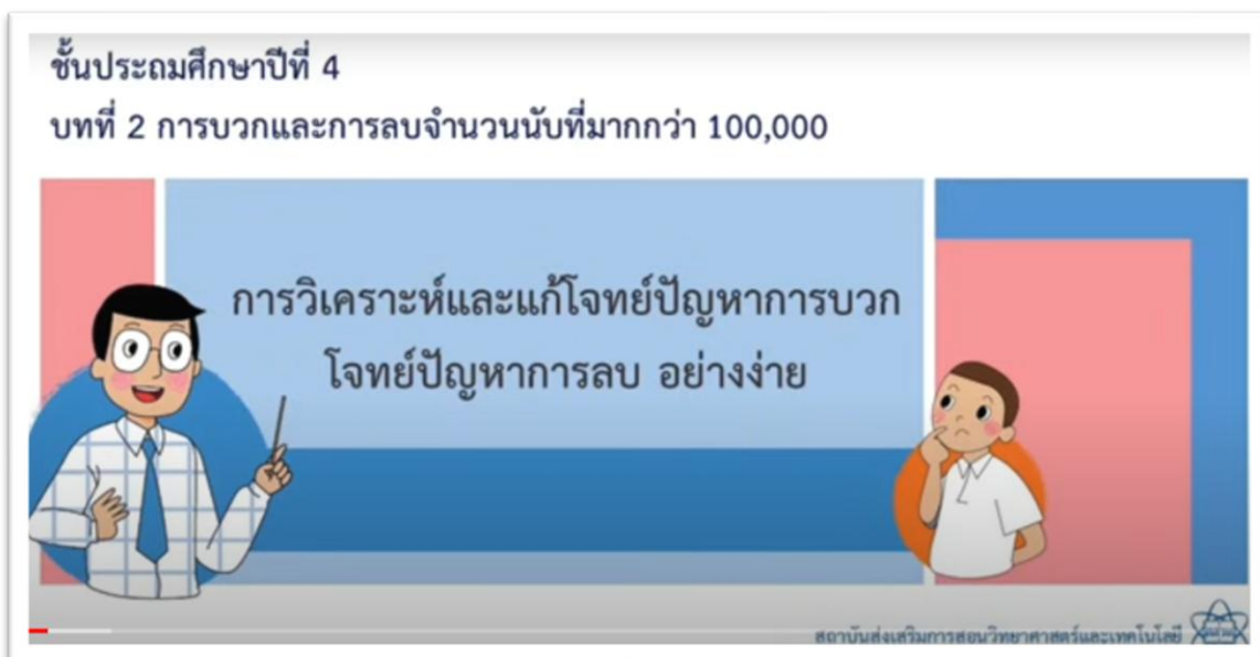
ภาพประกอบ (ภาพสื่อการสอน หรือ บรรยากาศการเรียนที่ใช้สื่อการสอน)

ก่อนที่จะเรียนรู้เนื้อหาได้เข้าสู่บทเรียนด้วยการสนทนาเพื่อเตรียมความพร้อมเกี่ยวกับการแก้โจทย์ปัญหา จากนั้นนำเข้าสู่บทเรียนด้วยการให้ศึกษา วีดิทัศน์ เรื่อง การแก้โจทย์ปัญหาจากง่ายไปยาก หลังจากนั้นช่วยกันสรุปองค์ความรู้พร้อมกับรับแบบฝึกหัดหน่วยที่ 4 ไปทบทวนที่บ้าน